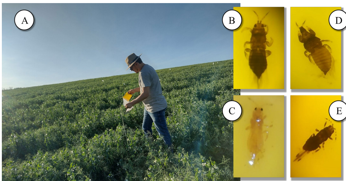
Figura 1. Amostragem de tripses em plantas de ervilha (variedade Gallant) cultivada no município de Pires do Rio, Goiás, Brasil. Fig. 1A (Montagem das armadilhas em campo), Fig. 1B ( Frankliniella brevicaulis ), Fig. 1C ( Frankliniella schultzei ), Fig. 1D ( Arorathrips mexicanus ) e Fig. 1E ( Caliothrips phaseoli ).

Portanto, cinco amostras de armadilhas adesivas amarelas contendo insetos capturados foram coletadas para cada dia de avaliação correspondendo aos 15, 30, 45, 60, 75 e 90 dias após o plantio (DAP). Insetos pertencentes a outros nichos ecológicos, como herbívoros, inimigos naturais e outros sem nicho definido também foram coletados pelas armadilhas, mas não contabilizados no presente trabalho.